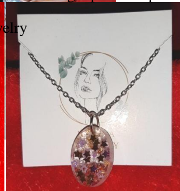
Gambar 8. Produk Jewelry