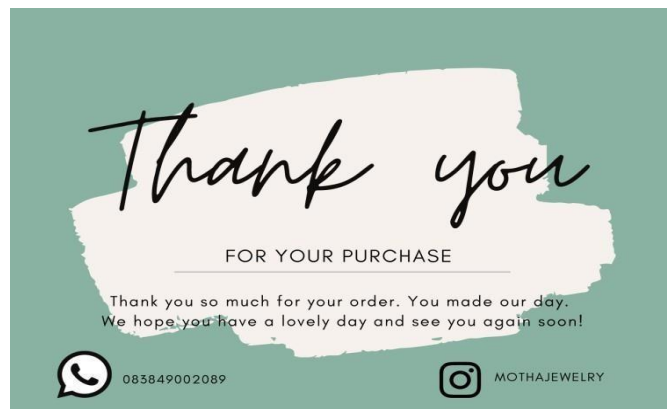
Gambar 5. Logo Usaha & Thank You Card