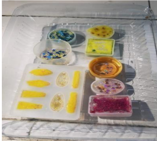
Gambar 3. Pengeringan Jewelry

Pada gambar 2 menjelaskan tentang tata cara pembuatan jewelry dimulai dari pencampuran bahan resin, katalis, glitter bubuk, dan glitter motif sebagai bahan dasar pembuatan jewelry. Kemudian setelah pencampuran dituangkan kedalam cetakan silikon.