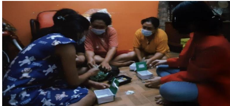
Gambar 6. Proses Packing Produk

Pada gambar 5 merupakan desain logo usaha jewelry yang akan digunakan sebagai identitas brand dari usaha dan desain thank you card yang merupakan bentuk apresiasi kepada calon pembeli.