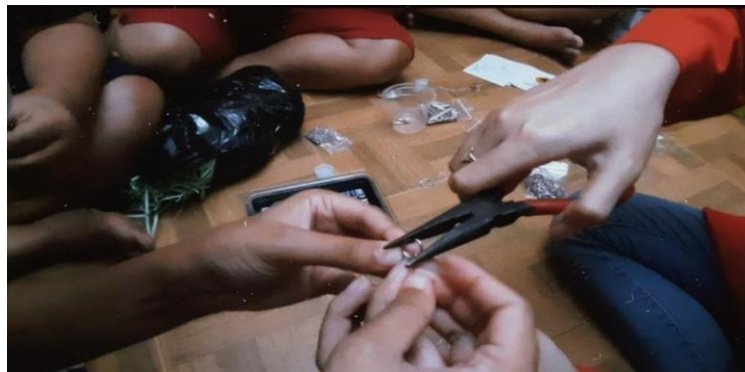
Gambar 4. Pemasangan Konektor Ring

Pada gambar 3 dilakukan pengeringan jewelry yang telah dibuat oleh Ibu-Ibu PKK selama satu hari penuh agar dapat mengeras dengan sempurna.