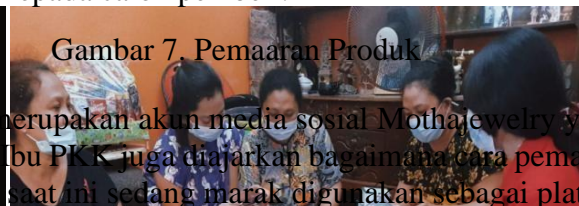
Gambar 7. Pemasaran Produk