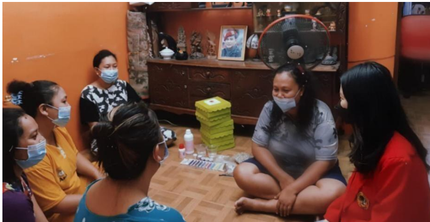
Gambar 1. Sosialisasi Usaha

Pandemi COVID-19 terbukti telah memberikan tekanan pada kondisi ekonomi dan sosial di Indonesia sejak akhir tahun 2019. Dampak dari virus corona ini tidak hanya berpengaruh pada kesehatan saja, tetapi juga berdampak pada ekonomi dan kesejahteraan masyarakat. Menurunnya perekonomian sosial juga dirasakan pada kampung Kalongan RT 04 RW 07 Kota Surabaya. Banyak warga yang mengalami penurunan pendapatan akibat Covid-19, disisi lain sebagian warga Kampung Kalongan RT 04 RW 07 banyak yang menggantungkan pendapatan suami saja. Salah satunya yaitu Ibu-Ibu PKK. Melalui Kegiatan pengabdian masyarakat yang dilakukan di Kampung Kalongan RT 04 RW 07 Surabaya yang berupa sosialisasi usaha agar dapat membantu perekonomian warga serta melalui program kerja ini dapat memberikan pengetahuan dan dapat menggali kreativitas Ibu-Ibu PKK yang mayoritas bekerja sebagai ibu rumah tangga.