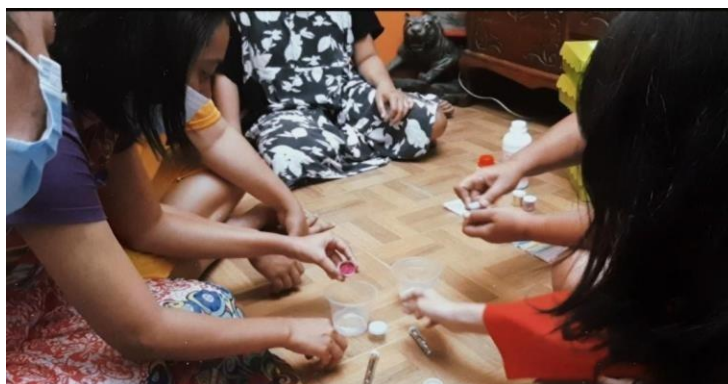
Gambar 2. Proses Pembuatan Jewelry

Pada gambar 1 merupakan kegiatan sosialisasi usaha kepada para Ibu-Ibu PKK RT 04 RW 07 dengan memberikan pengetahuan dan gambaran tentang usaha yang akan dibuat sehingga dapat menghasilkan suatu produk yang dapat diperdagangkan dan dapat menambah pemasukan.