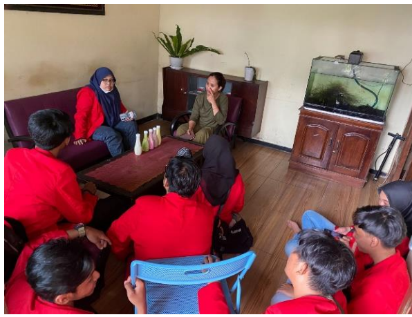
Gambar 1 diskusi dengan mitra

Selanjutnya pada tanggal 14 Januari dan 15 Januari 2024 kami mulai melakukan pembuatan yang telah di ditawarkan sebelumnya sebagai hasil produksi yang disukai oleh masyarakat umum yaitu es lilin susu sapi murni, permen susu sapi murni, puding jelly susu sapi murni yang mengandung protein dengan pengolahan yang higienies dan efisien.