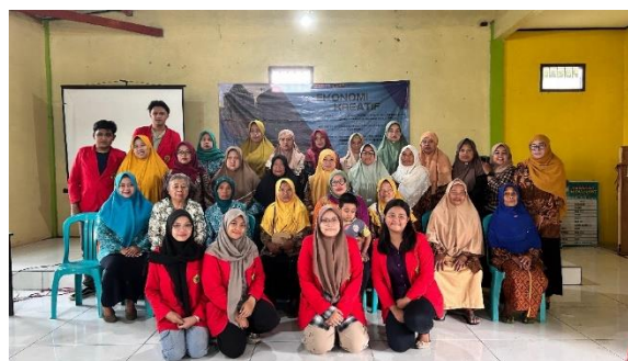
Gambar 5 hasil sosialisasi dengan ibu-ibu PKK

Selanjutnya pada tanggal 16 Januari 2024 kami melaksanakan program kerja kami yaitu sosialisasi pendampingan dan pelatihan cara pembuatan makanan dan minuman dari inovasi olahan susu sapi murni terhadap ibu-ibu PKK. Alhamdulillah acara sosialisasi yang diadakan di balai Dusun Treceh Desa Sajen Pacet. Berjalan dengan lancar dan banyak ibu pkk yang bertanya serta memberikan saran kepada jenis produk yang kami jelaskan.