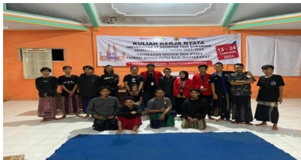
Gambar 1. Pelaksanaan kegiatan pelatihan pembuatan logo pada aplikasi canva

Canva secara umum dapat digunakan untuk kebutuhan grafis seperti pembuatan flyer, poster, kartu ucapan, sertifikat, presentasi, dan infografik dengan gambar dan template yang menarik (Purwati & Perdanawanti, 2019). Canva adalah salah satu dari banyak aplikasi desain online yang muncul di dunia teknologi. Ini memungkinkan Anda membuat presentasi, resume, poster, brosur, booklet, grafik, infografis, spanduk, bookmark, buletin, dll. Kategori presentasi yang tersedia di Canva meliputi pendidikan, bisnis, periklanan, teknologi, dan kreatif (Idawati et al., 2022).