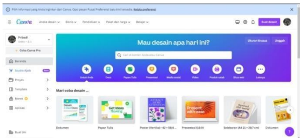
Gambar 3 Proses Pelatihan Penggunaan aplikasi canva

Kemampuan mereka dalam menyusun elemen-elemen grafis dan mengatur tata letak secara kreatif meningkat, menciptakan desain yang lebih profesional dan efektif. Pelatihan ini tidak hanya menyentuh aspek teknis desain grafis, tetapi juga mendorong kreativitas dan pemikiran visual yang lebih inovatif. Para peserta dapat lebih kreatif dalam memilih dan mengombinasikan elemen desain, menciptakan karya yang unik dan sesuai dengan karakter Karang Taruna. Selain itu, pelatihan Canva juga memberikan manfaat tambahan dalam hal kolaborasi..