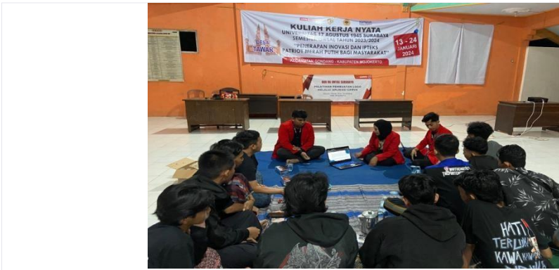
Gambar 2 Suasana saat pelatihan Canva

Kemampuan mereka dalam menyusun elemen-elemen grafis dan mengatur tata letak secara kreatif meningkat, menciptakan desain yang lebih profesional dan efektif. Pelatihan ini tidak hanya menyentuh aspek teknis desain grafis, tetapi juga mendorong kreativitas dan pemikiran visual yang lebih inovatif. Para peserta dapat lebih kreatif dalam memilih dan mengombinasikan elemen desain, menciptakan karya yang unik dan sesuai dengan karakter Karang Taruna. Selain itu, pelatihan Canva juga memberikan manfaat tambahan dalam hal kolaborasi..