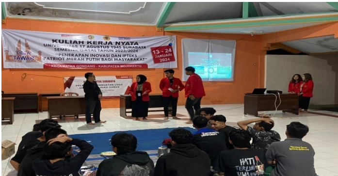
Gambar 4 suasana evaluasi pada kegiatan pelatihan canva

Pemberdayaan ini melalui pemahaman desain tidak hanya menghasilkan materi visual yang menarik tetapi juga membantu Karang Taruna membangun citra yang kuat dan kohesif. Dengan kemampuan untuk mengomunikasikan nilai-nilai dan tujuan mereka melalui desain visual yang kuat, Karang Taruna dapat memperkuat identitas mereka dalam benak masyarakat, meningkatkan kesadaran, dan mendukung keberlanjutan program dan kegiatan mereka. Dengan demikian, pemahaman prinsip-prinsip desain bukan hanya sebagai keterampilan teknis, tetapi juga sebagai alat pemberdayaan bagi anggota Karang Taruna. Hal ini membuka peluang untuk lebih aktif berpartisipasi dalam berbagai kegiatan masyarakat, memberikan kontribusi yang lebih berarti, dan menjadikan media visual sebagai sarana yang efektif untuk menyampaikan pesan-pesan masyarakat.