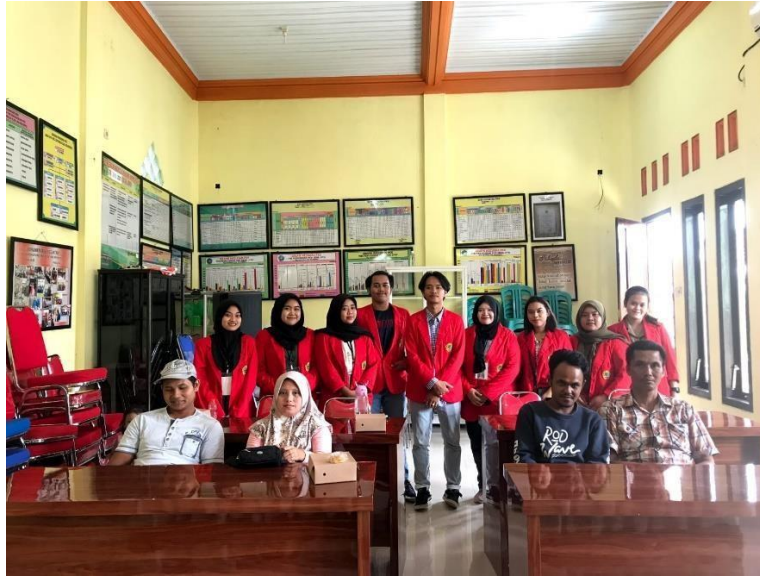
Gambar 3: Mahasiswa berfoto dengan pelaku UMKM Meubel

Analisa pembagian kuisiонер response dilakukan untuk mengetahui pengetahuan dan kemampuan pelaku UMKM Meubel terkait materi pelatihan yang disampaikan. Adapun hasil analisa pembagian pre test dan post sebagai berikut :