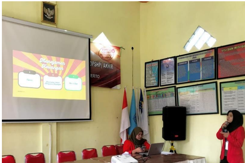
Gambar 1 Mahasiswa Menyampaikan Materi Pelatihan