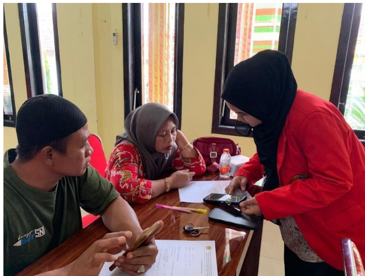
Gambar 2: Mahasiswa memberikan pelatihan aplikasi Credibook