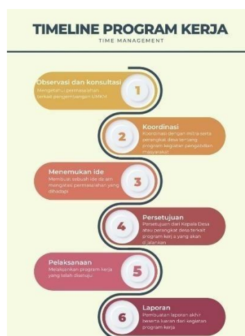
Gambar 1. Infografis tahapan pelaksanaan kegiatan

Metode pelaksanaan kegiatan pengabdian yang dilakukan Mahasiswa Universitas 17 Agustus 1945 Surabaya dalam program Peningkatan Kapasitas dan Keterampilan Ibu-Ibu PKK dalam Mengoptimalisasi Usaha Desa dengan melaksanakan kunjungan lokasi di Desa Dilem Kecamatan Gondang Kabupaten Mojokerto untuk mengetahui problematika yang dihadapi Desa Dilem. Berikut tahapan pelaksanaan kegiatan pengabdian, khususnya Ibu-ibu PKK adalah sebagai berikut: