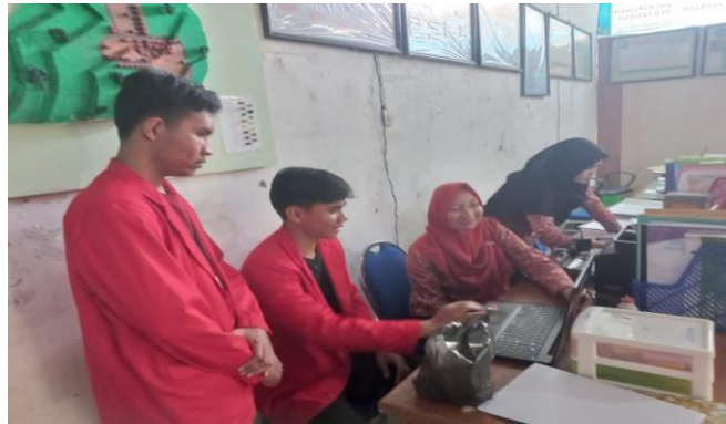
Gambar 1. Pelatihan Website profil desa ke perangkat desa

Pada gambar 1 ditunjukkan kegiatan pelatihan kepada aparat desa yang telah ditunjuk oleh kepala desa, dalam hal ini adalah admin desa. Pelatihan kepada admin desa untuk mengelola data-data yang berkaitan dengan informasi tentang kondisi masyarakat di Desa Beganalimo.