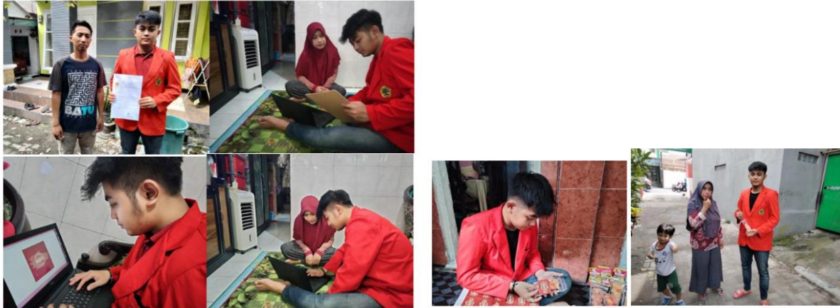
Gambar 2 Bagan Pelaksanaan Kegiatan

Metode pelaksanaan yang dilakukan dalam penelitian ini meliputi beberapa tahapan yang akan dilakukan sebagai berikut :