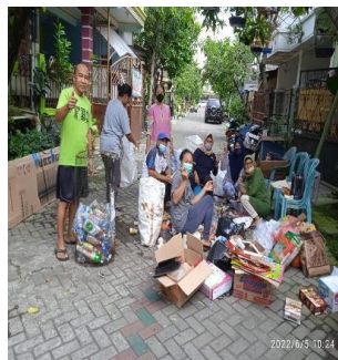
(Pemilahan botol bekas)