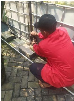
(perbaikan kolam lele)