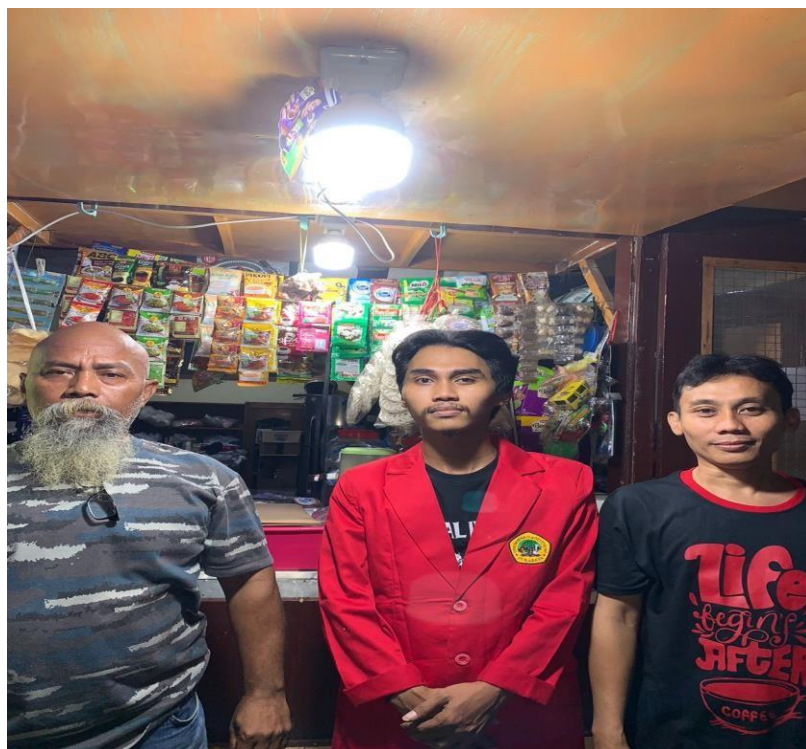
Gambar.4 Melakukan pendampingan terkait pemasangan CCTV di RT 01.