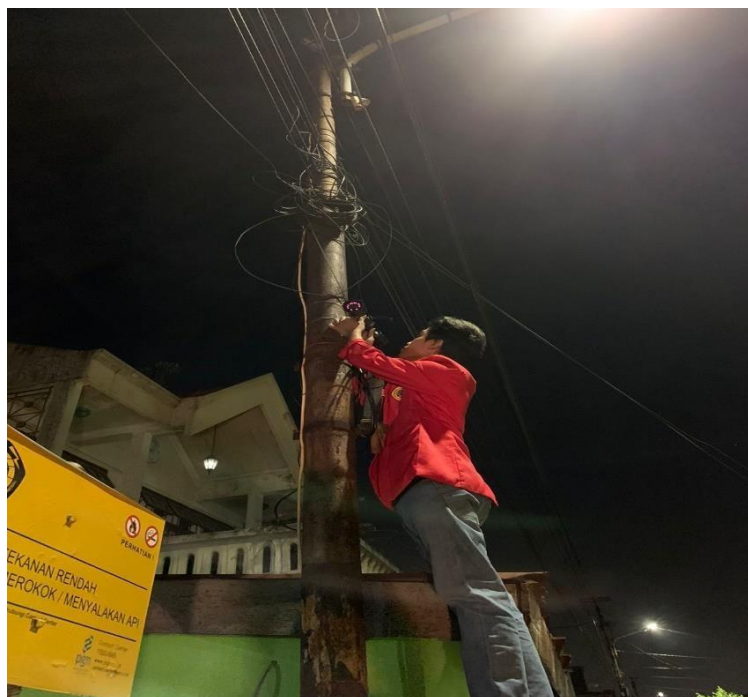
Gambar 2. Melakukan pemasangan CCTV di titik ke 1