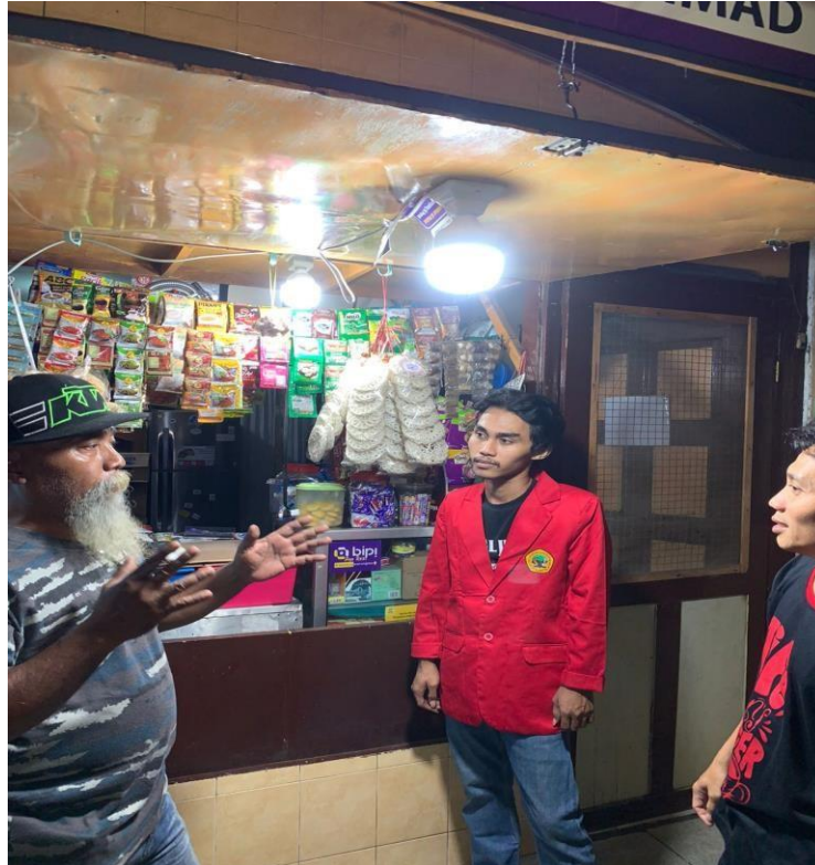
Gambar 1. Memberikan arahan kepada Pak RT dan Pak RW

Berdasarkan permasalahan mitra yang dihadapi maka saya selaku pengusul program berusaha untuk mengatasi permasalahan dengan berbagai cara diantaranya :