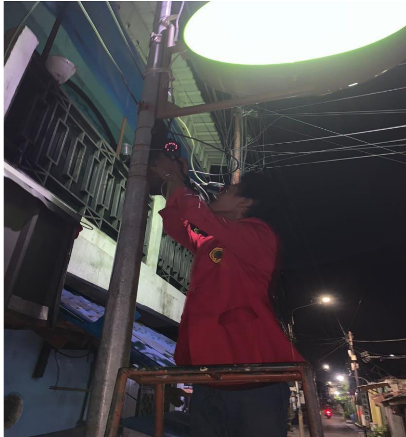
Gambar.3 Melakukan pemasangan CCTV di titik ke 2