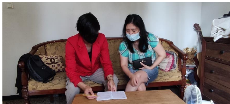
Gambar 3. Melakukan sosialisasi tentang digital marketing kepada mitra dan memberi pembelajaran dalam mengelola media sosial yang berfungsi untuk digital marketing, supaya dapat meningkatkan pendapatan selain berjualan secara offline.