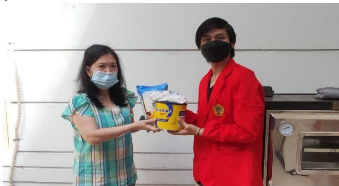
Gambar 1. Memberikan bahan baku kepada mitra, untuk pembuatan kue kering.

Bagian ini Berdasarkan permasalahan yang dihadapi oleh mitra, maka saya selaku pelaksana kegiatan KKN berusaha untuk membantu serta mengatasi permasalahan dengan berbagai cara diantaranya :