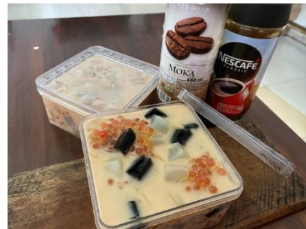
Gambar 5. Produk jajanan Es Kopi dan Jelly dengan mitra