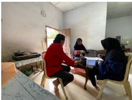
Gambar 4. Demo dalam Pembuatan Produk