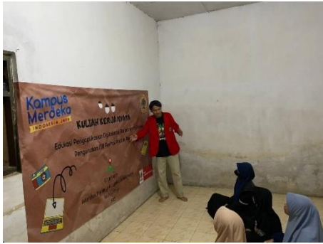
Gambar 2. Edukasi Digitalisasi marketing kepada Mitra