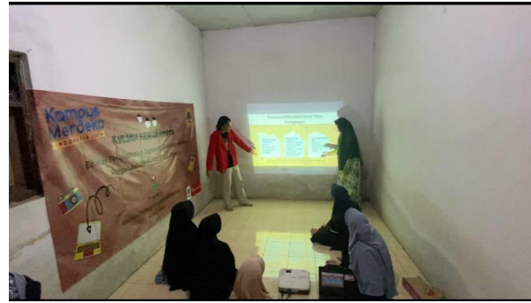
Gambar 3. Edukasi penjelasan surat izin usaha perdagangan dan pengurusannya