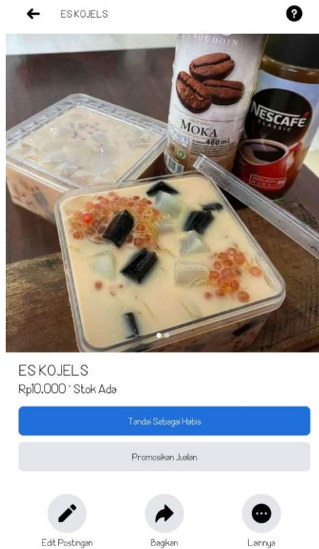
Gambar 7. Digital marketing lewat media online Facebook