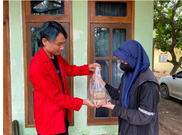
Gambar 8. Luaran dengan pemberian secara percuma hasil produk mitra sebagai awal memulai usaha dan agar dikenal lainnya.