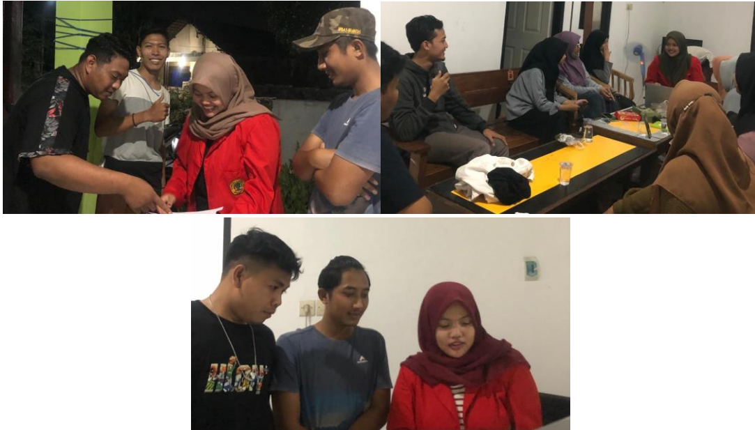
Gambar 2 Bagan Pelaksanaan Kegiatan