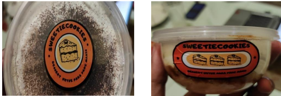
Gambar 3. Logo pada Kemasan