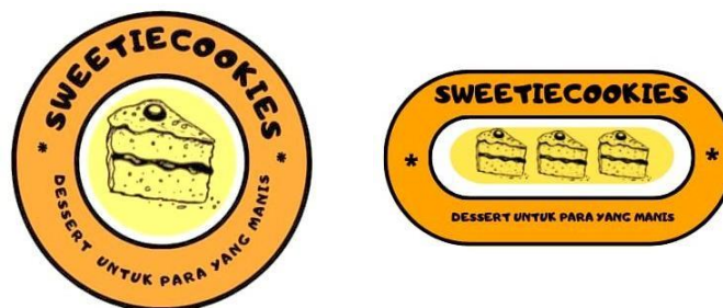
Gambar 2. Desain Logo

Inovasi lainnya adalah pembuatan logo dan tagline yang mudah diingat oleh customer nantinya. Penggantian cup juga diganti agar terlihat lebih menarik karena cup kemasan yang digunakan sebelumnya. Logo yang dibuat adalah hasil pemikiran antara mitra dan penulis. Lalu tagline yang ditetapkan merupakan usulan penulis yang kemudian disetujui oleh mitra. "Dessert Untuk Para Yang Manis"