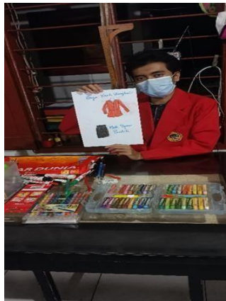
Gambar 1.1 Membuat sketsa gambar baju

Membuat sketsa baju sangat diperlukan bagi seorang penjahit untuk memudahkan baju yang akan dibuat, kelanjutanya dalam proses dari pembuatan pola baju, penguntingan bahan kain sampai proses penjahitan baju hingga hasil akhir menjadi lebih maksimal sesuai dengan keinginan si pemakai