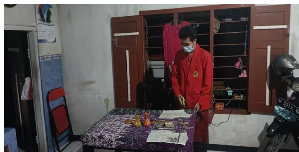
Gambar 4.1 Pengguntingan bahan kain

Praktek pendampingan belajar mengunting bahan kain untuk baju lengan pendek kra bundar dengan bahan kain yang mudah di cari tapi nyaman dipakai untuk aktifitas sehari-hari dengan harga kain terjangkau sesuai dengan selera pengguna.