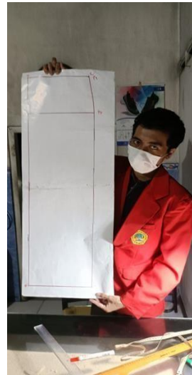
Gambar 3.1 Contoh rok span panjang