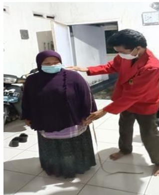
Gambar 2.1 Cara mengambil ukuran badan