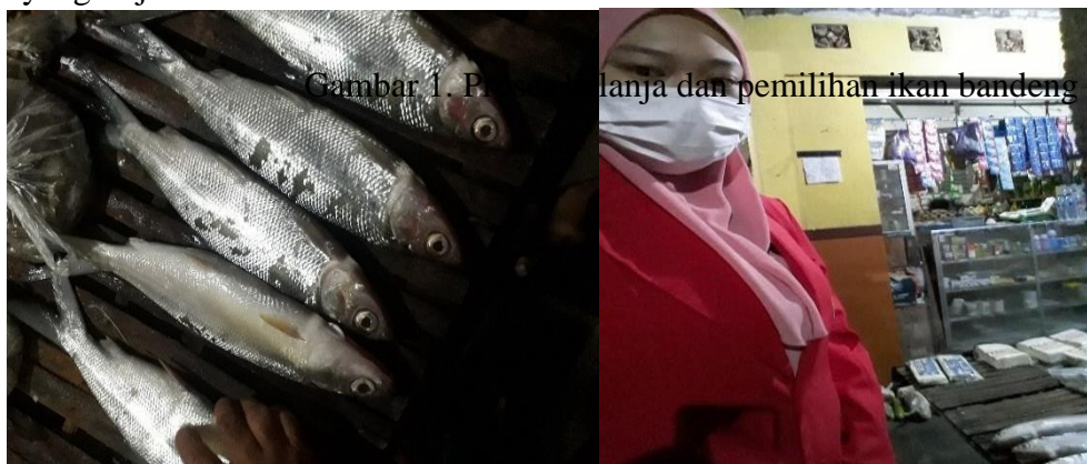
Gambar 1. Penjualan dan pemilihan ikan bandeng

Setelah pelaksanaan kerja sama Mitra dengan peserta pengabdian masyarakat UNTAG Surabaya, dampak yang terjadi adalah, keuntungan, banyak pesanan, kemampuan manajemen dan pemasaran yang diperoleh. Namun, UMKM tetap harus memiliki strategi untuk terus bertahan di tengah pandemi ini dan dituntut untuk dapat menyesuaikan diri terhadap kondisi yang terjadi.