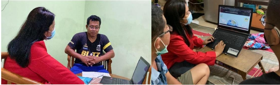
Dari kiri: pelatihan bersama Ketua RT, pelatihan bersama sekretaris RT dan perwakilan warga