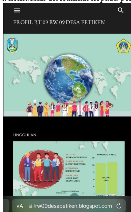
Web log RT 09Foto