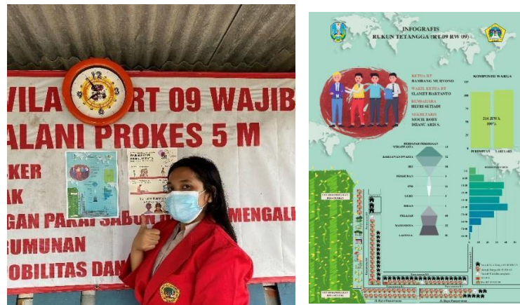
Infografis pada pos RT 09