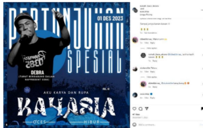
Gambar 5 Feed Post

Analisis strategi komunikasi pemasaran terpadu mengungkapkan bahwa Komunitas Rumah Baca Aksara terutama mengandalkan advertising, public relations and publicity, sales promotion, event experience, dan online and social media marketing dalam upayanya mempromosikan produk dan membangun hubungan dengan konsumen. Dengan memanfaatkan kekuatan media sosial, terutama Instagram, komunitas ini berhasil menjangkau konsumen dengan beragam strategi pemasaran yang mencakup promosi penjualan, kegiatan acara dan pengalaman, serta pemasaran online.