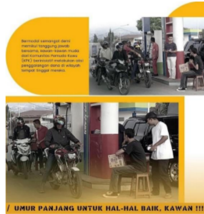
Gambar 2 Galang Dana

yang sedang menghadapi kondisi hidrosefalus. Dengan melakukan kegiatan ini, Komunitas Rumah Baca Aksara tidak hanya berfokus pada aspek pemasaran produk, tetapi juga menunjukkan keterlibatan mereka dalam kegiatan amal sebagai bagian dari strategi public relations.