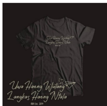
Gambar 3 Baju dengan Tulisan Goet

Komunitas Rumah Baca Aksara memanfaatkan strategi sales promotion dengan efektif melalui media sosial Instagram. Mereka berbagi informasi mengenai penawaran menarik, seperti diskon harga sebesar 10%, sebagai langkah awal untuk menarik perhatian konsumen dan memperkenalkan usaha sablon baju. Selain itu, Komunitas Rumah Baca Aksara juga melibatkan diri dalam kegiatan giveaway sebagai bentuk promosi untuk memperkenalkan produk secara kreatif. Dalam wawancara, informan menjelaskan bahwa promosi penjualan ini tidak hanya sebatas menjual produk, tetapi juga mencoba untuk memperkenalkannya melalui konsep-konsep yang menarik. Selain diskon, identitas desain yang menarik dan relevansi dengan isu yang ingin disampaikan menjadi fokus dalam upaya membangun loyalitas konsumen. Kesadaran akan pentingnya promosi sebagai alat untuk menyebarkan informasi produk menjadi dasar bagi Komunitas Rumah Baca Aksara dalam membangun komunikasi pemasaran yang efektif dan terarah, dengan harapan dapat menciptakan hubungan yang positif dengan konsumen serta meningkatkan penjualan produk mereka.