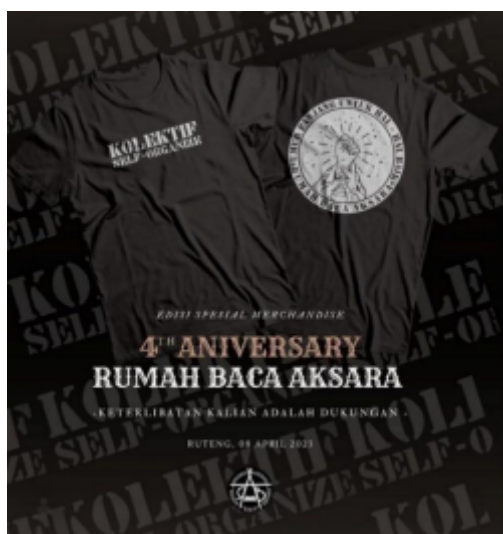
Gambar 4 Merchandise

Komunitas Rumah Baca Aksara aktif menggelar berbagai acara dan pengalaman untuk menarik perhatian konsumen serta memperkenalkan diri kepada masyarakat. Salah satu contoh adalah perayaan ulang tahun ke-4 Komunitas Rumah Baca Aksara, yang diadakan dengan penuh keseruan dan menarik partisipasi masyarakat. Acara tersebut melibatkan berbagai kegiatan, seperti pembagian hadiah, merchandise, dan kolaborasi dengan komunitas lain, seperti komunitas hiphop dan disabilitas. Selain mengadakan acara sendiri, komunitas ini juga aktif berpartisipasi dalam event bersama komunitas lain, seperti Music Baca Kita dan Selangka Cama, sebagai platform untuk memperkenalkan produk mereka. Komunitas Rumah Baca Aksara juga terlibat dalam kegiatan live bersama, di mana mereka menyelenggarakan sesi sablon bersama untuk belajar bersama komunitas lain atau pengunjung yang tertarik, dengan biaya yang terjangkau. Semua ini mencerminkan komitmen komunitas untuk terus berinovasi, berbagi pengalaman, dan menjalin hubungan yang positif dengan masyarakat sekitar.