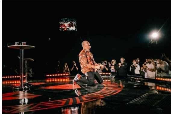
Gambar 1 Hubungan Manusia dengan Tuhan

Pesan moral adalah suatu ajaran berupa perilaku baik dan buruk yang disampaikan oleh pembuat pesan kepada penerima pesan yang bertujuan untuk memberikan suatu pembelajaran yang bermanfaat. Menurut (Burhan, 2018) pesan moral dibagi menjadi tiga, yakni (1) hubungan manusia dengan tuhan, (2) hubungan manusia dengan dirinya sendiri, dan hubungan manusia dengan manusia lainnya.