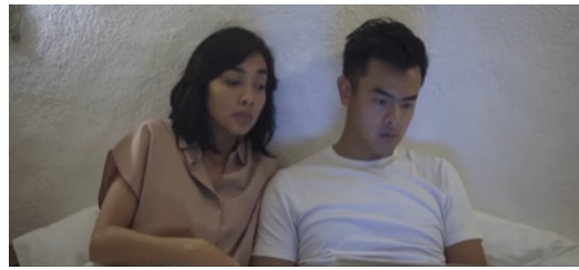
Gambar 3. Scene 4 (Eps 3)

Kontruksi industri yang Dalam adegan ini, Sore ditampilkan menyuruh Jonathan untuk terus bekerja dan berusaha bekerja di pagi hari meski ia terbiasa bekerja di malam hari. Pagi dan sore hari merupakan waktu paling produktif untuk bekerja. Karena ini waktu terbaik untuk beraktivitas, Anda bisa bersantai di malam hari. Sebaliknya, bekerja di malam hari akan berdampak berbahaya bagi kesehatan tubuh Anda. Tubuh dapat terkena dampak dari kondisi seperti diabetes, kanker, penyakit jantung, stroke, dan bahkan depresi.