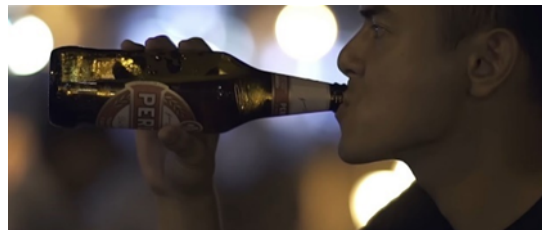
Gambar 2. Scene 2 (Eps 1)

Dari sini terlihat jelas bahwa tanda gaya hidup sehat dalam adegan tersebut mengacu pada kurangnya kesadaran masyarakat saat ini terhadap kesehatan dirinya sendiri dan orang lain pada khususnya. Perubahan dalam hal ini sebaiknya dimulai dari hal-hal sederhana yang berhubungan dengan kesehatan, seperti memenuhi kebutuhan tubuh akan istirahat dan menjauhi zat-zat tidak sehat seperti rokok.