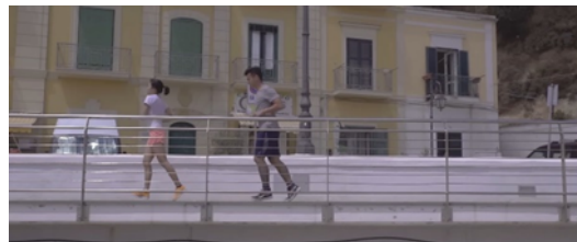
Gambar 4. Scene 5 (Eps 4)

Kontruksi industri akan prinsip dasar hidup sehat adalah Seseorang bekerja pada jam produktivitas pagi dan sore hari guna memenuhi kebutuhan alami tubuhnya akan gerak dan istirahat pada waktu yang tepat. Ia mengilustrasikan salah satu cara menjaga kesehatan dengan cara ini karena tubuh memerlukan istirahat dan aktivitas pada waktu yang berbeda-beda.