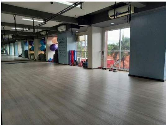
Gambar 2 Fasilitas Ruang Olahraga

Dengan hasil-hasil ini, dapat disimpulkan bahwa program magang tidak hanya memberikan manfaat akademik dan keterampilan teknis, tetapi juga berkontribusi terhadap observasi, pelaksanaan, dan evaluasi kebijakan publik di tingkat lokal, menjadikan pengalaman ini relevan dengan bidang Administrasi Negara.