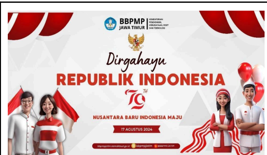
Gambar 2. Contoh Hasil Pelatihan Canva

Canva terbukti menjadi alat yang efektif untuk mendukung tim publikasi BBPMP Jawa Timur dalam menghasilkan desain yang kreatif dan efisien. Dibandingkan dengan aplikasi desain profesional lain seperti Adobe Photoshop atau Illustrator, Canva memiliki kelebihan dari segi kemudahan penggunaan dan aksesibilitas. Canva menyediakan berbagai template dan elemen grafis yang siap digunakan, sehingga mempercepat proses desain bagi pengguna dengan latar belakang non-desain. Selain itu, fitur kolaborasi di Canva memungkinkan banyak pengguna bekerja pada satu proyek secara bersamaan, meningkatkan produktivitas tim.