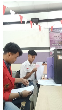
Gambar 3 mengerjakan tugas yang diberikan oleh karyawan