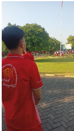
Gambar 2 Melakukan Senam Rutin di hari jumat bersama Karyawan

➤ Controlling (Pengawasan) merupakan seluruh kegiatan pengawasan dari semua komponen manajemen kearsipan sehingga pelaksanaan manajemen kearsipan dapat berjalan sesuai standar tertentu, efektif, dan efisien.