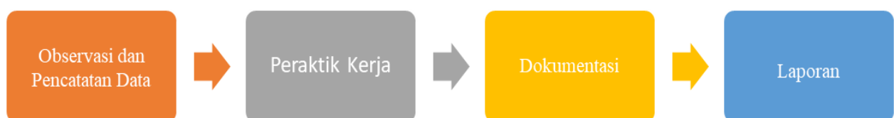
Gambar 1. Bagan Alir Kegiatan PKM

Metode yang digunakan penulis untuk mempermudah dalam proses pelaksanaan magang di instansi sebagai berikut :