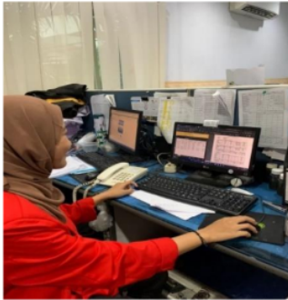
Gambar 2 Monitoring Bunker pada Kapal

Dengan demikian, pemahaman mendalam mengenai peran penting perencanaan dan perbekalan logistik dalam mendukung operasional kapal di PT. Dharma Lautan Utama menjadi kunci dalam meningkatkan kinerja perusahaan dan memastikan kelancaran aktivitas kapal secara keseluruhan.