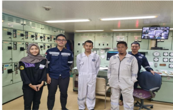
Gambar 3 Survey dan Pembekalan stock BBM kapal di Perak