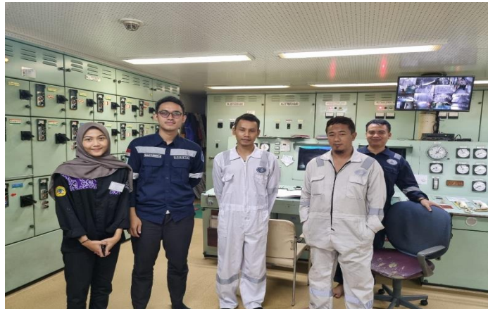
Gambar 3 Survey dan Pembekalan stock BBM kapal di Perak