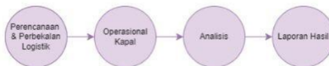
Gambar 1. Diagram Metode Pelaksanaan Kegiatan