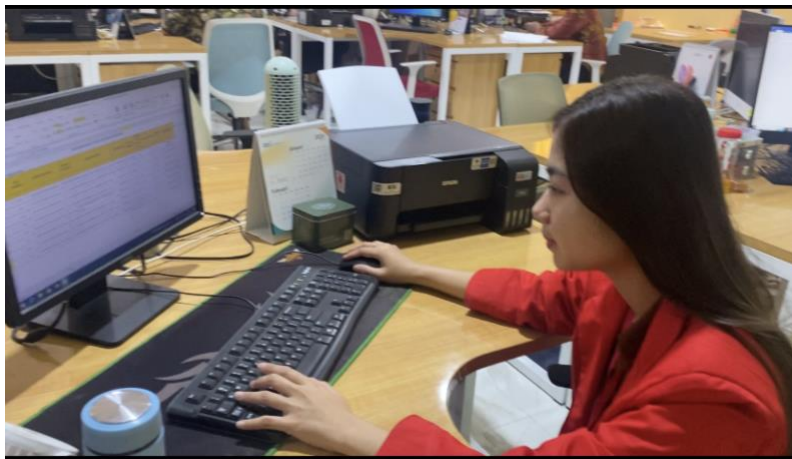
Gambar 4. Kegiatan Administrasi kepegawaian (Penginputan surat, mencatat surat dan penyimpanan dokumen)