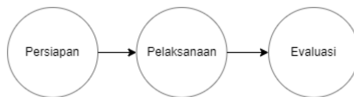
Gambar 1. Diagram Langkah Pelaksanaan Kegiatan

Pelaksanaan magang ini dilaksanakan mulai tanggal 15 Januari 2024 hingga 8 Maret 2024 di PT Kereta Api Indonesia Daop 8 Surabaya. Perancangan kegiatan ini menerapkan metode dan langkah yang telah diterapkan oleh para ahli, meliputi tahap persiapan, pelaksanaan, evaluasi, dan pembuatan laporan (Iswati, 2019).