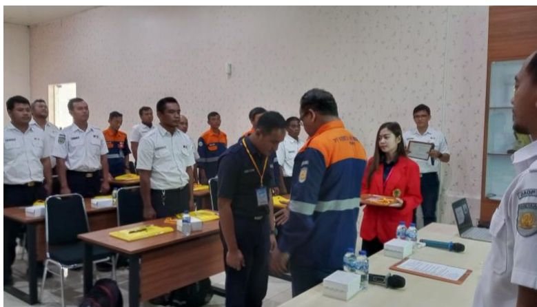
Gambar 2. Kegiatan diklap atau pelatihan pegawai KAI Daop 8 Surabaya

Selama pelaksanaan magang di PT. Kereta Api Indonesia Daop 8 Surabaya penulis mendapatkan pengalaman kerja yang berharga yang berguna bagi penulis untuk memasuki dunia kerja yang sesungguhnya.