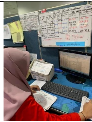
Gambar 2 Menginput nota pengeluaran barang