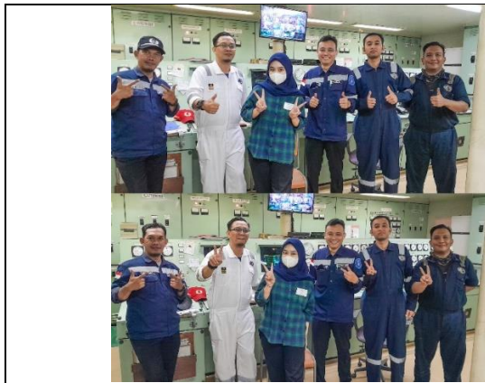
Gambar 1 Kunjungan kapal DF7