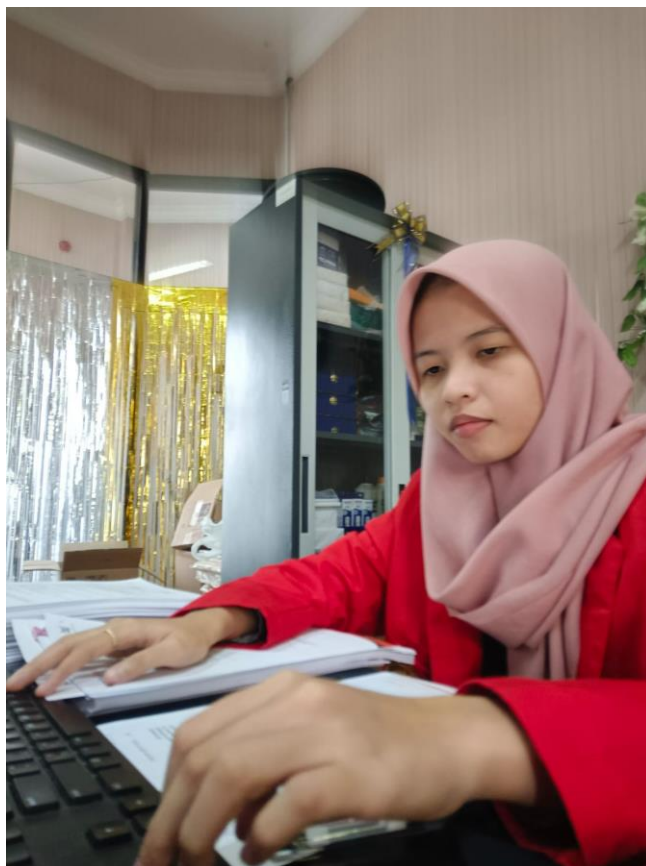
Gambar 1. Menginput Surat Masuk

Untuk mengatasi hal tersebut penulis akan tetap melaksanakan pekerjaan yang diberikan oleh staff dengan solusi bertanya kepada karyawan atau staff lain, dan jika ada tugas disuruh mengantarkan dokumen atau surat ke ruang lain jika tidak hafal dengan ruangnya bisa juga bertanya kepada staff atau karyawan lain yang masih didalam ruang lingkup divisi tersebut. Selain itu pada saat penulis kesulitan mencari berkas dan dokumen yang tersusun tidak benar penulis akan mencari solusi dengan mencari tanggal, tahun, waktu bayar dan nama pemilik dokumen tersebut agar dapat mempermudah pekerjaan penulis.